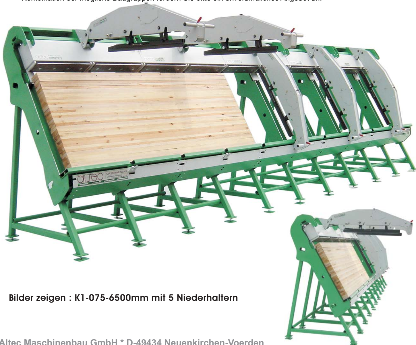
Bilder zeigen : K1-075-6500mm mit 5 Niederhaltern

Die hier abgebildeten Beispiele zeigen nur einige Maschinenzusammenstellungen. Für eine individuelle Kombination der mögliche Baugruppen fordern Sie bitte ein unverbindliches Angebot an.